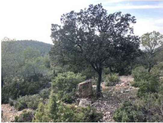
● Árbol especial (encina)