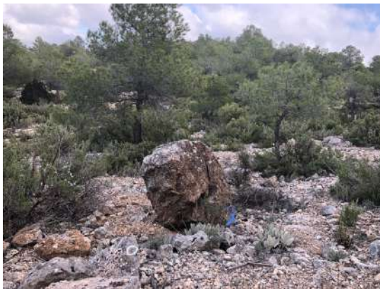
● Roca aislada