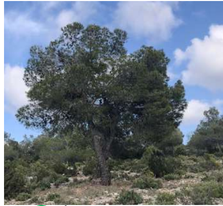
○ Árbol destacado