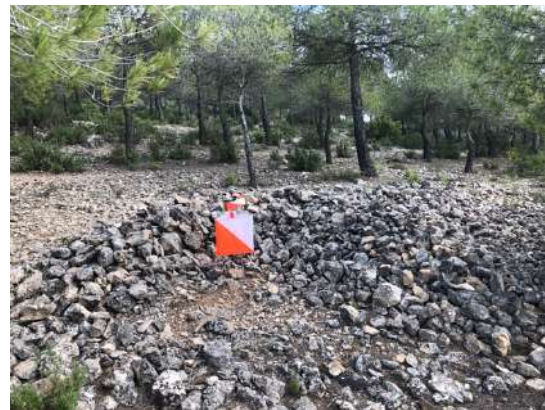
✕ Agrupación de piedras